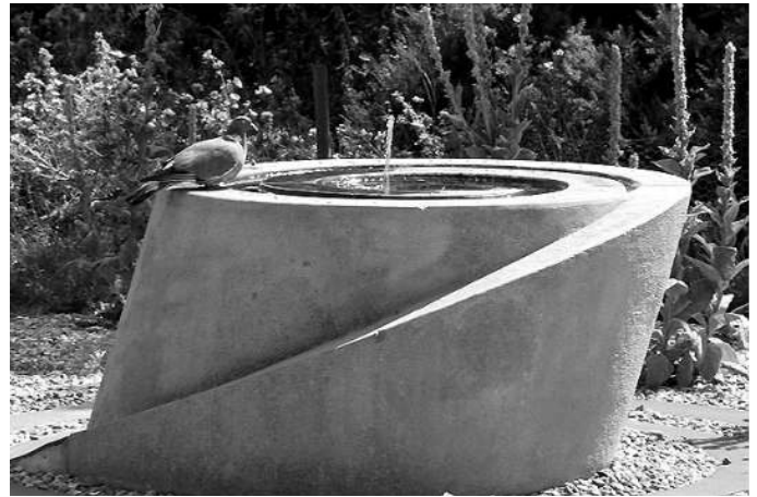
Yr Ardd Goffa yn Greenham

“Ges i sioc pan ddywedodd Helen ei bod hi am fynd i Greenham yn y lle cynta’. Yn amlwg, ro’n i wedi clywed am ferched eraill yn mynd, ond roedd hyn yn wahanol . Fel mam, yn naturiol, ro’n i’n llawn pryder. A do’n i ddim yn hapus. Ond mynd oedd hi am wneud – roedd hi wedi penderfynu. Ac roedd hi’n ferch aeddfed oedd â syniadau pendant iawn.