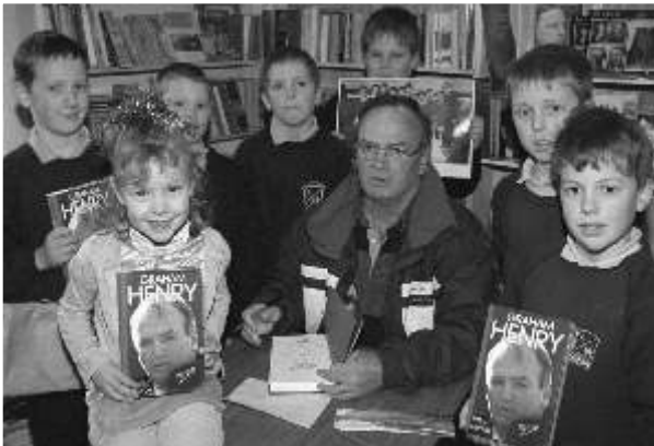
Yr hyfforddwr rygbi, Graham Henry, yn denu'r torfeydd