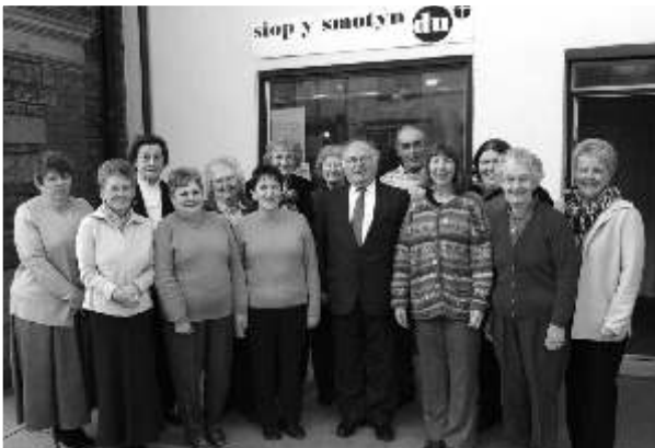
Gwirfoddolwyr y siop mewn llun a dynnwyd ychydig flynyddoedd yn ôl