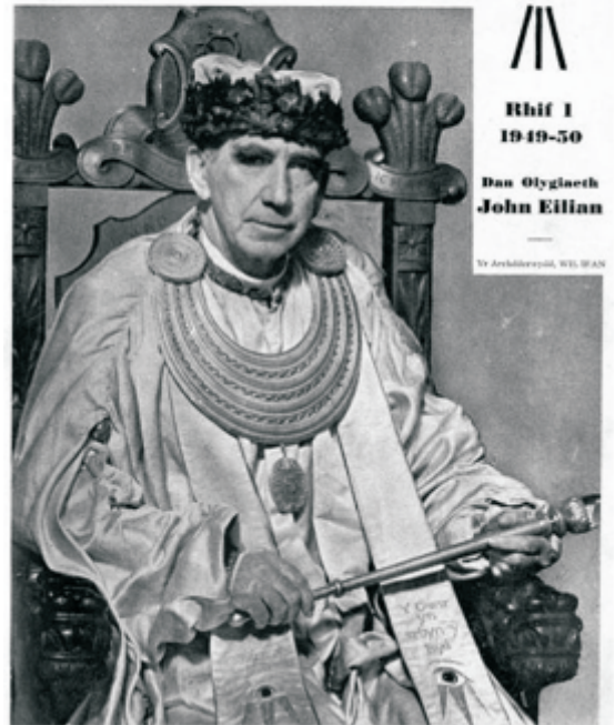
Wil Ifan, yn ei gyfnod yn Archdderwydd

CYLCHGRAWN BLYNYDDOL GORSEDD Y BEIRDD A'R EISTEDDFOD